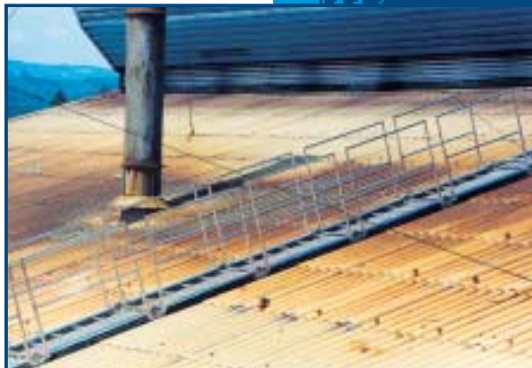
Accès à la ligne de vie aux usines Verdome (Saint-Gobain).