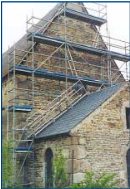
Pose d'un échafaudage sur une toiture en ardoise.