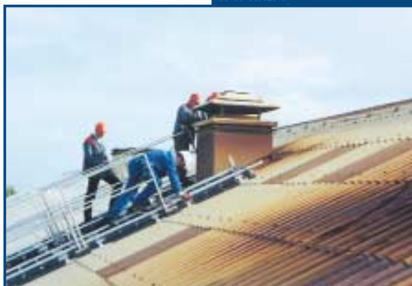
Accès à un groupe de ventilation pour remplacement de celui-ci aux Acieries Erasteel.