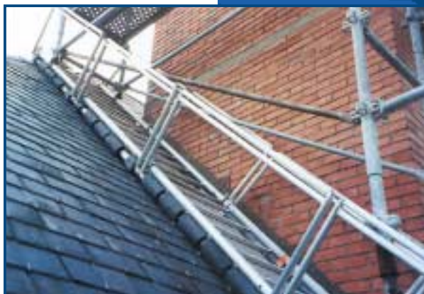
Échafaudage autour d'une cheminée pour arraser celle-ci en partie haute.