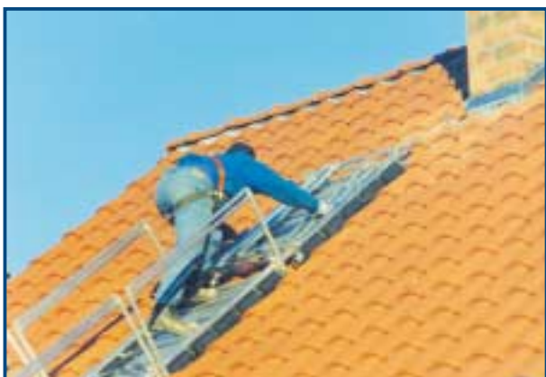
Mise en place du Sauvetoit pour accès à une cheminée pour pose d'antenne.